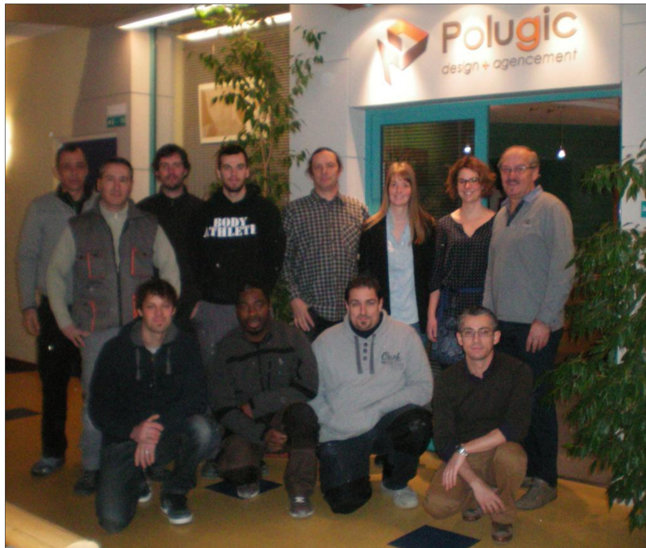
L'équipe Polugic design agencement.

Prisée des particuliers comme des professionnels de la restauration, de la bijouterie-joaillerie et des magasins en tout genre, la signature Polugic est devenue un gage d'excellence qui explique en partie la notoriété de l'entreprise sur l'ensemble du territoire, avec un pic majeur sur la région des Pays de Savoie et la Suisse voisine, de Genève à Lausanne et Zurich depuis peu. « Nous sommes